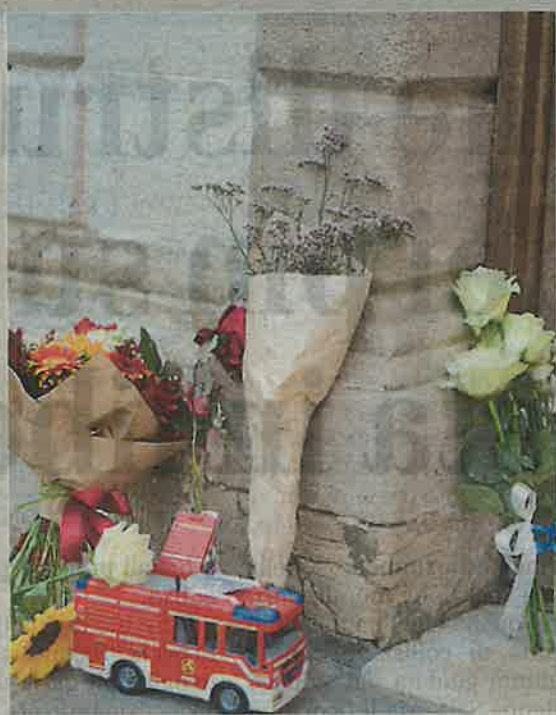
DRAMMA Fiori e un gioco per il bambino ucciso a Trieste

Borrelli, Braghieri, Sorbi e Tagliaferri alle pagine 14 e 15